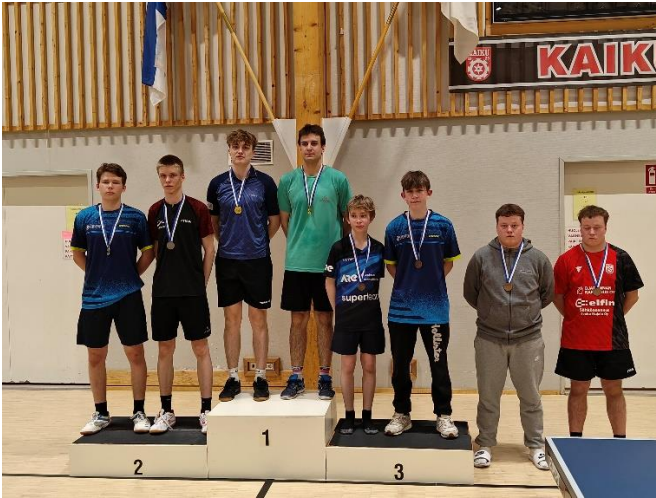
18-vuotiaiden nelinpelin SM-mitalistit