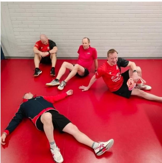
KoKa 3 rentoutuu raskaan turnauksen jälkeen

Kosken Kaiku tekee yhteistyötä SPTL:n sekä Varsinais-Suomen pöytätennisseurojen kanssa.