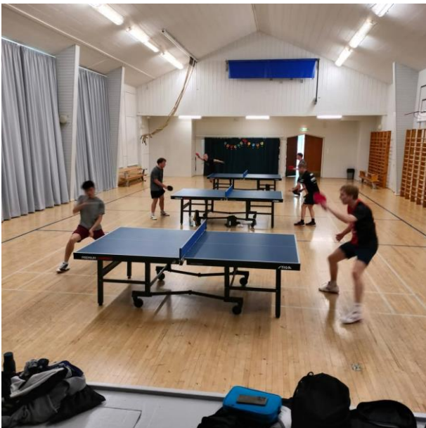
Koulun salissa harjoituspeli TuKaa vastaan

Masan ja Rassen Pingiskoulu pyöri sekä kevät- että syyskaudella. Kaiku sai siihen OKM:n seuratukea toiseksi vuodeksi.