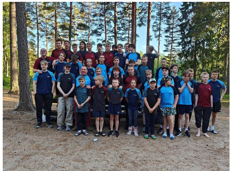
Kesäleirin osallistujat yhteiskuvassa