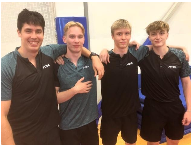
NETU 2024: Iloinen Suomen joukkue voitettuaan Ruotsin loppuottelussa